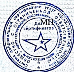
схема сертификации 4

НА ОСНОВАНИИ Акта оценки оказания услуг от 27.01.2022г. № 140, протоколов испытаний продукции АИЛ Филиал ФБУЗ «Центр гигиены и эпидемиологии в Нижегородской области в Канавинском, Московском, Сормовском районах г. Н. Новгорода, городского округа г. Бор» от 23.06.2021 №№ 15609, 15610, от 21.12.2021 № 26215, Протоколы смывов от 12.08.2021 №№ 20176-20185, от 14.12.2021 №№ 31117-31126.